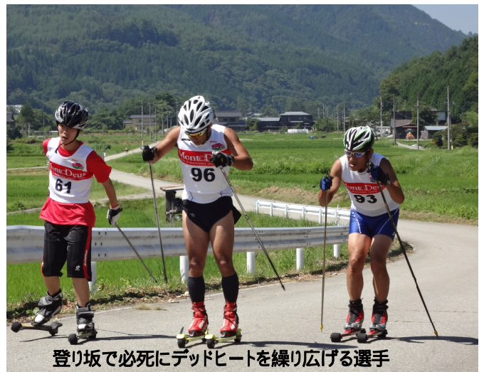
登り坂で必死にデッドヒートを繰り広げる選手

去年は大雨警報のため、当大会は中止になりましたが、今年行う事ができてよかったです。選手の皆さん、家族や関係者の皆さん、大変お疲れさまでした。(広報委員 中畑)