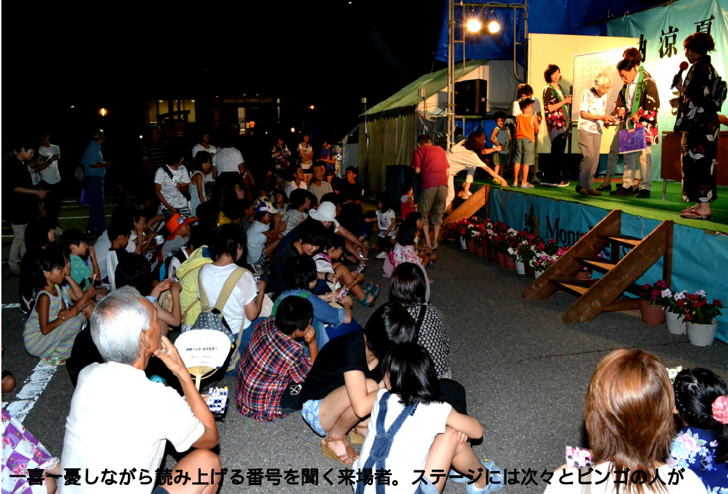
一喜一憂しながら読み上げる番号を聞く来場者。ステージには次々とビンゴの人が

飛騨一之宮納涼夏祭りが8月14日 衣姿の幼児や中学生が目立つなど、一之宮支所駐車場で開催され、浴 千人ほどが会場に足を運んで大いに