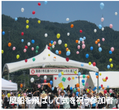
風船を飛ばして式を祝う参加者

宮崎は急カーブの難所で、特に冬期にスリップ事故など多発して交通渋滞の要因でした。トンネル化により安全でスムーズな流れの通行が期待されます。