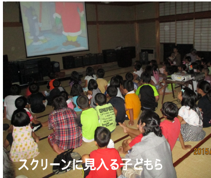
スクリーンに見入る子どもら

参加者は園児ら110人で、孫同伴のおじいちゃん、おばあちゃん姿も見られ、笑ったりしながら楽しそうにスクリーンに見入っていました。(広報委員 野口)