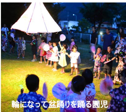
輪になって盆踊りを踊る園児

後半は園児たちによる子ども盆踊りが披露され、続いて行われた宝探し(きもだめし)では、暗い園内にいる鬼さん大泣きする子どもも。最後は打ち上げ花火を鑑賞して親子で楽しい夏の思い出ができました。(広報委員 野添)