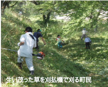
生い茂った草を刈払機で刈る町民

参加者は、熱中症に気を付けながら汗だくで作業を行い、作業終了後は、各々親睦会を開いて昼間の作業を労いました。(広報委員 伊藤)