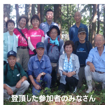
登頂した参加者のみなさん

山頂の眺めは良くないものの、城は急な登りや切堀があり、河原の石が敷き詰められ、小さな祠があるなど、山城の雰囲気を感じられました。(広報委員 山腰)