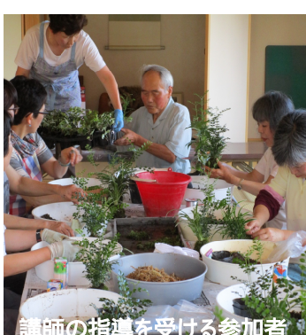
講師の指導を受ける参加者

女性委員会位山地区では寺元公民館で7月26日に13人が参加して「コケ玉作り」を行いました。植物の根を土で球状に包み、その周りをコケで覆って糸で巻く作業に四苦八苦しながら「真ん丸で可愛いな」「どこに飾ろうか」等、満足な出来栄に楽しい一時を過ごしました。(広報委員 牛丸)