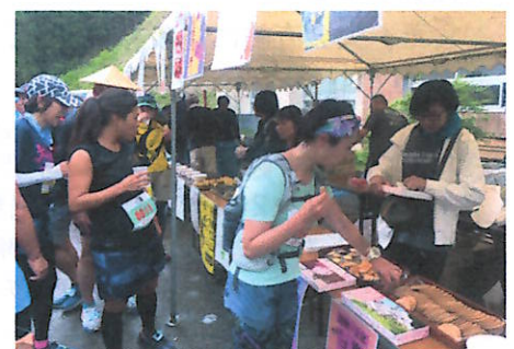
エイドに立ち寄るランナー

名物となった(?)アイスクリームが好評で、冷たさと甘さでリフレッシュしたランナーは、次のエイドに向かって行かれました。