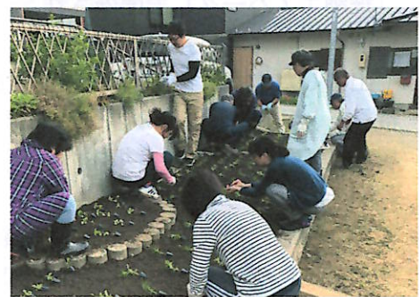
花植え作業をする参加者たち

夏には、一之宮町の各所で美しい花が見られることでしょう。皆さんも少し足を止めて、町の花壇をお楽しみください。