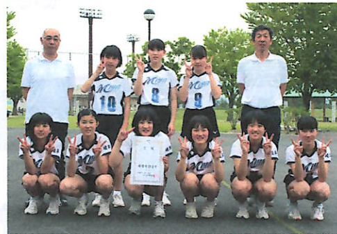
笑顔でピースサインの子供たち