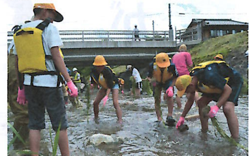
バイカモを植える宮小6年生