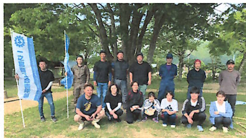
高山西商工会青年部、 宮保育園職員の皆さん

地域貢献がしたいという青年部の思いが、結果的に地域との絆の強化にも繋がりました。