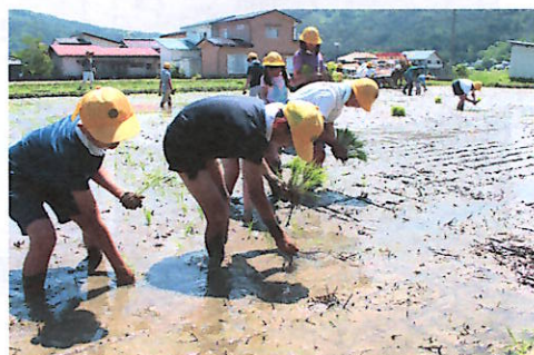
一苗ずつ丁寧に植える子どもたち④ 田植え定規を押す児童④

児童の中には、初めて田んぼに入る子もあり最初は大変そうでしたが、みんなで協力しながら歓声を上げて、泥だらけになりながらも田植えを楽しんでいました。