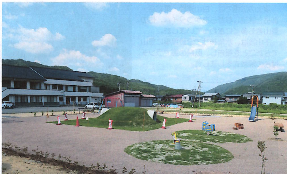
6月11日にオープンした「みやっこひろば」