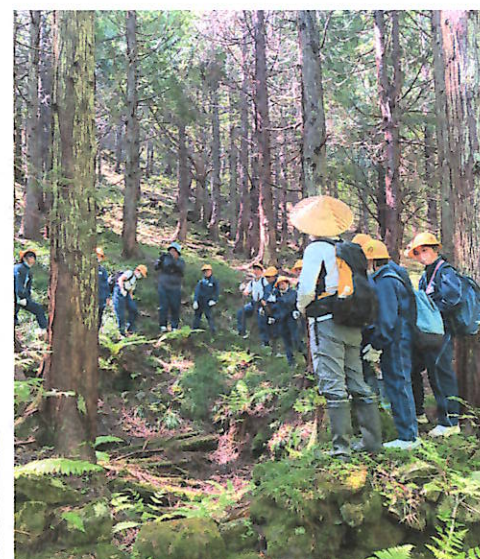
炭焼き跡地での説明④ 自然の声を聞く児童④