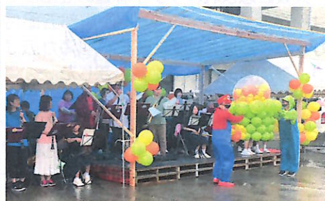
テープカットの様子④ テラコヤイチの様子⑤