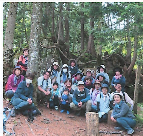
参加者の皆さん④ 山々の下に広がる雲海④