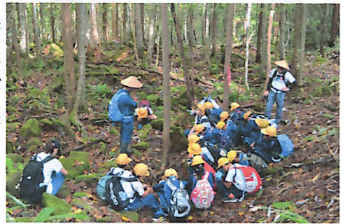
地下の水の流れる音が聞こえるかな

(注)蔵柱コースは、登山道が整備されていないため、山に詳しい方の案内が必要です。