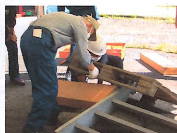
倒壊家屋救出訓練