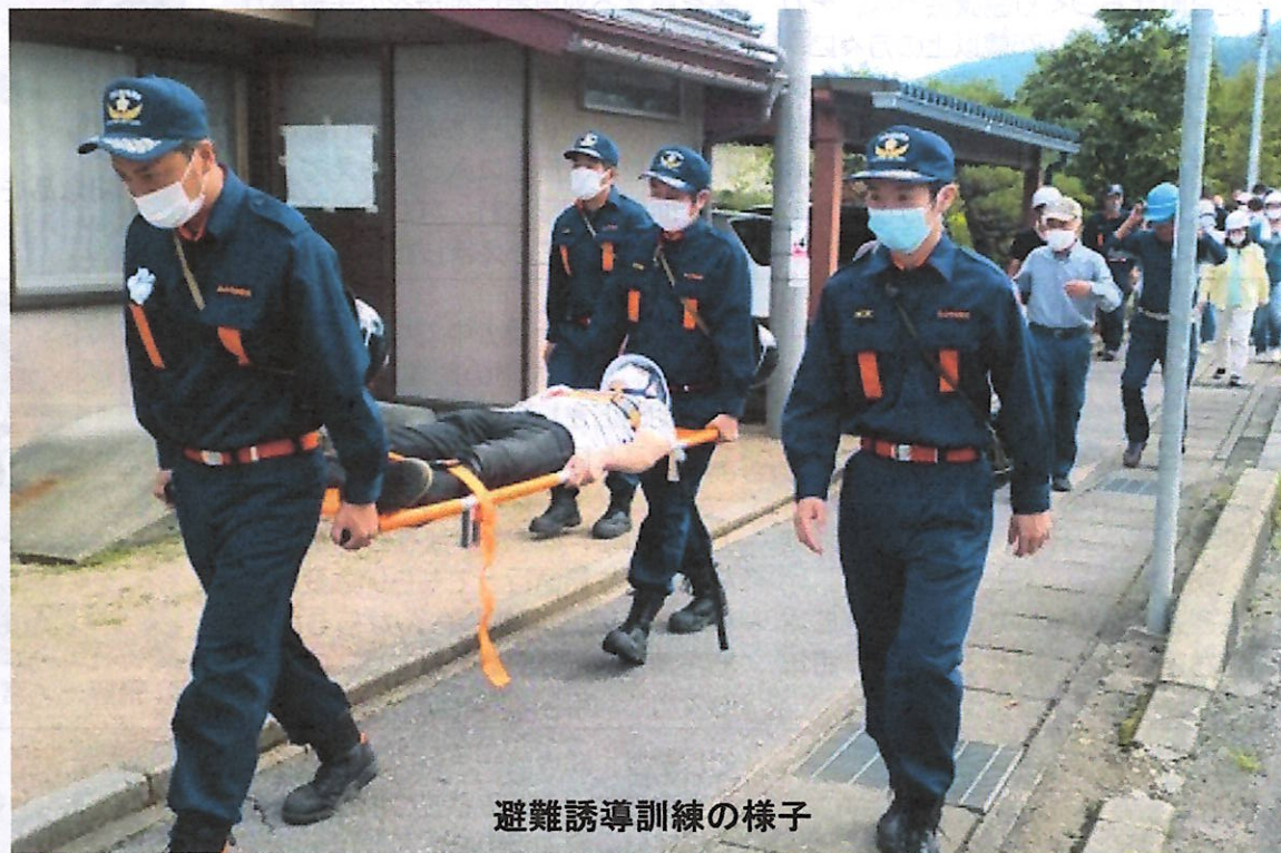
避難誘導訓練の様子