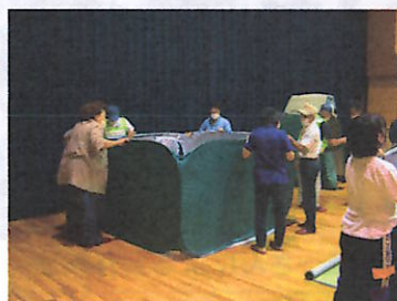
パーティション設置