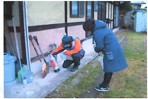
消火器の点検の様子