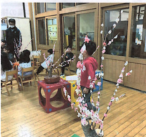
立派な花餅がたくさんできました

宮保育園年長児が田んぼで育てたもち米が、今年は12.6kgできました。そのもち米で12月15日、餅つきが開催されました。