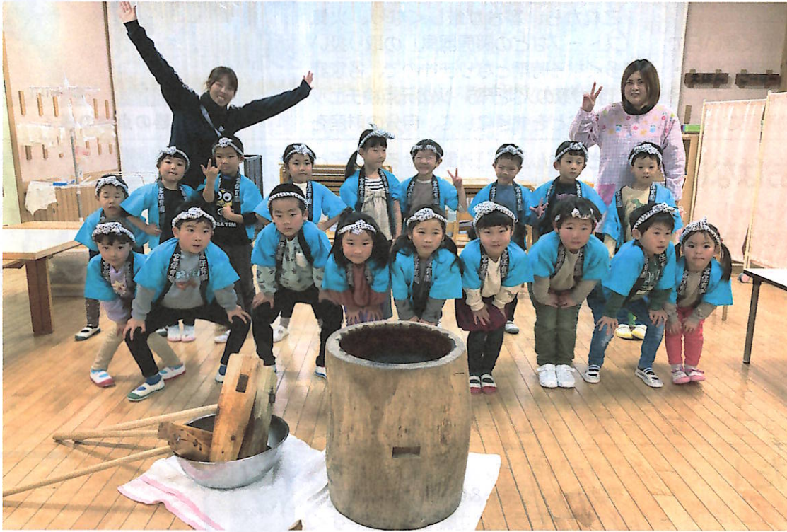
年長さん、法被に鉢巻き きまってるね！