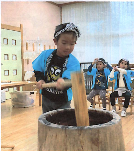
大きな杵でお餅つき