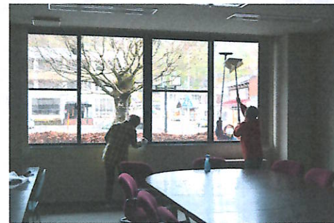
文化教養部奉仕作業の様子