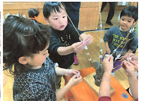
小さい子たちも花餅づくりに参加