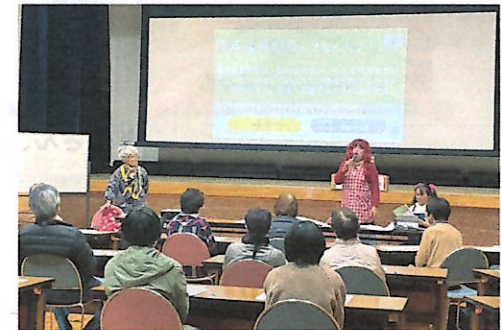
寸劇を交えての講座