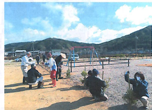
みやっこひろば雪囲い作業の様子