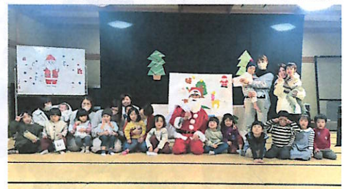
サンタさんと記念撮影