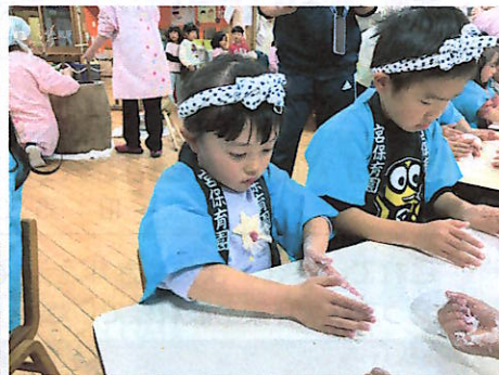
鏡餅づくりに挑戦