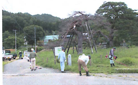
夫婦松の下草を刈り取る長寿会員

蒸し暑かったものの、曇りで、気温も高くならず、多くの高齢者が参加の中で無事終了することができました。