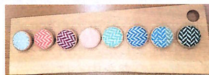
こぎん刺し講座の様子と作品