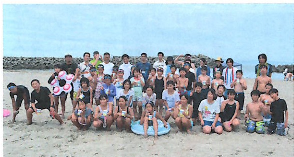
かき氷を食べながらハイポーズ！