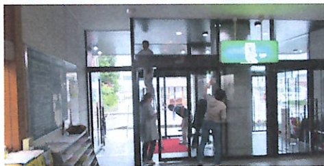
玄関のガラスもさっぱりきれいに！

ますが、あいにくの梅雨空で、今年は室内のガラス拭きを中心に行いました。日頃きれいに使用されており、作業も1時間足らずで終了しました。連休の中での奉仕活動、頭の下がる思いです。ありがとうございました。