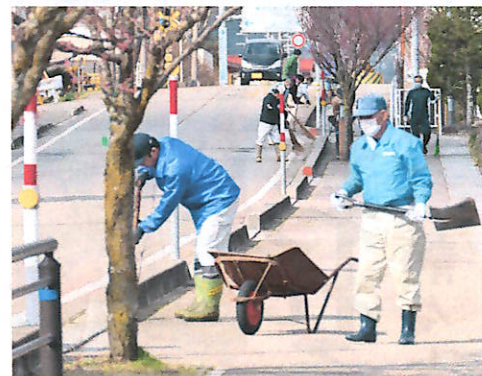
距離をとっての作業

夏にも環境整備作業がありますが、ゴミなどは少なく、天候も平穏で大雨などの被害が無いことを願っています。