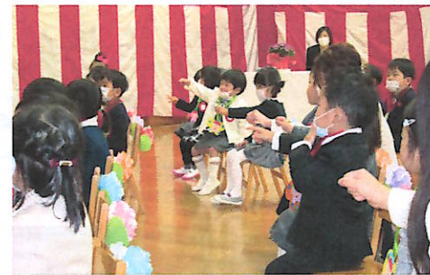
マスク姿で不安と期待の新入園児

休校中も先生方は、子ども達の学習・生活面の対応に一生懸命がんばっています。学校再開の折には、地域の方々にも子ども達のため、色々な支援をお願いします。