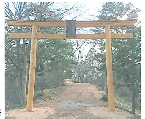
立派に取りかえられた鳥居

残念ながら今年は御旅行列がありません。近くを通られた方は一度ご覧になってみてください。