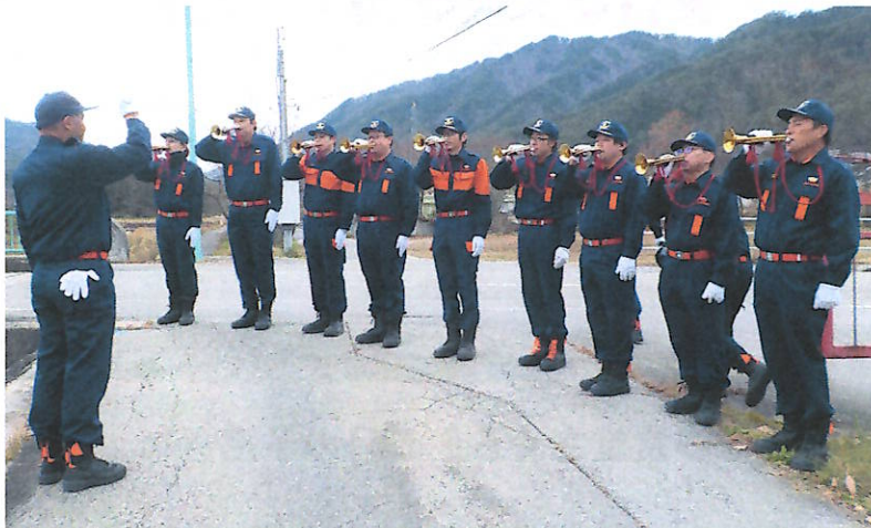
秋季訓練時におけるラッパ吹鳴

今後も一之宮消防団の活性化を促進し、魅力ある消防団づくりや団員確保にも大いに寄与するため、練習を積んでまいりますのでよろしくお願いいたします。