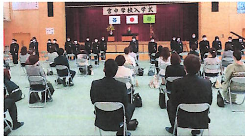
中学校入学式の様子

4月16日、政府は緊急事態宣言を全国に拡大。岐阜県は特定警戒県とされ、高山市でもコロナウイルスの感染拡大防止のため保育園・小学校・中学校・高校・特別支援学校の臨時休校を5月31日まで再延長すると発表されています。(4/27現在)