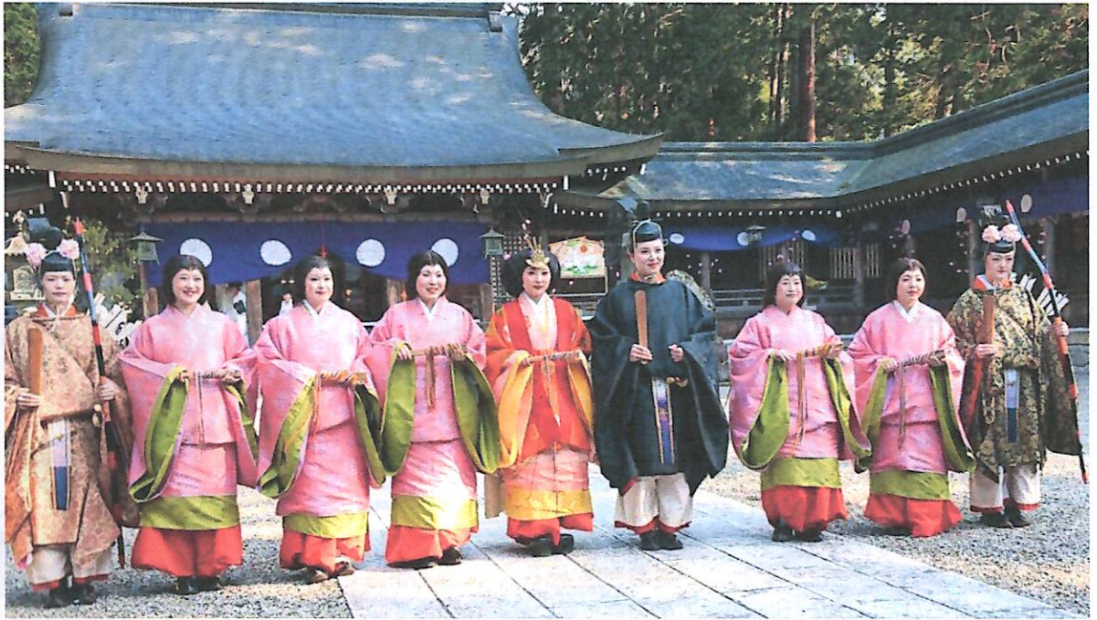
境内に整列する9人の生きびな様