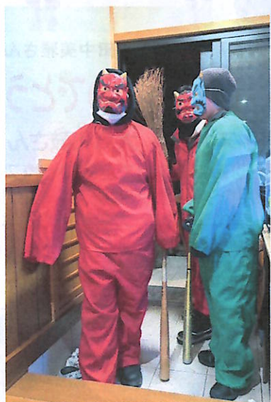
元気に鬼は外！ 福は内！！