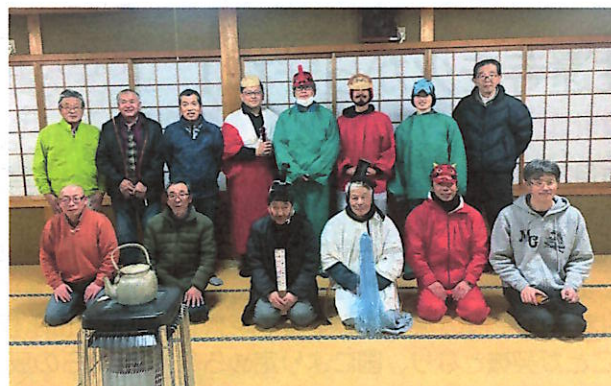
節分行事を盛り上げる有志の方々

近年少子化が進み、大声で泣き叫ぶ声が聞こえる家も少なくなりましたが、私たちが子どもの頃は太鼓と鉦の音が聞こえてくると、鬼が近くまで来たとドキドキしたものです。今では節分と言うと家庭で太巻きを食べることが風習となってきましたが、『鬼は外！福は内！』といった日本の古くから馴染みのある文化が今後も可能な限り続くことを願います。