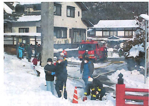
放水訓練を行う住民の皆さん