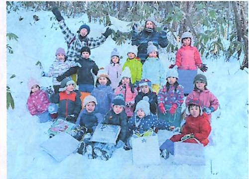
そり滑り、たのしい！！