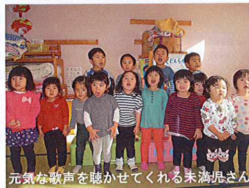
元気な歌声を聴かせてくれる未満児さん