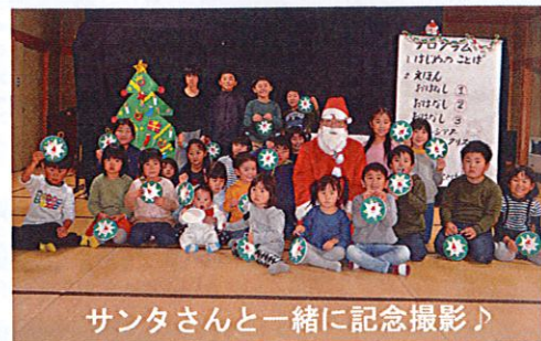
サンタさんと一緒に記念撮影♪