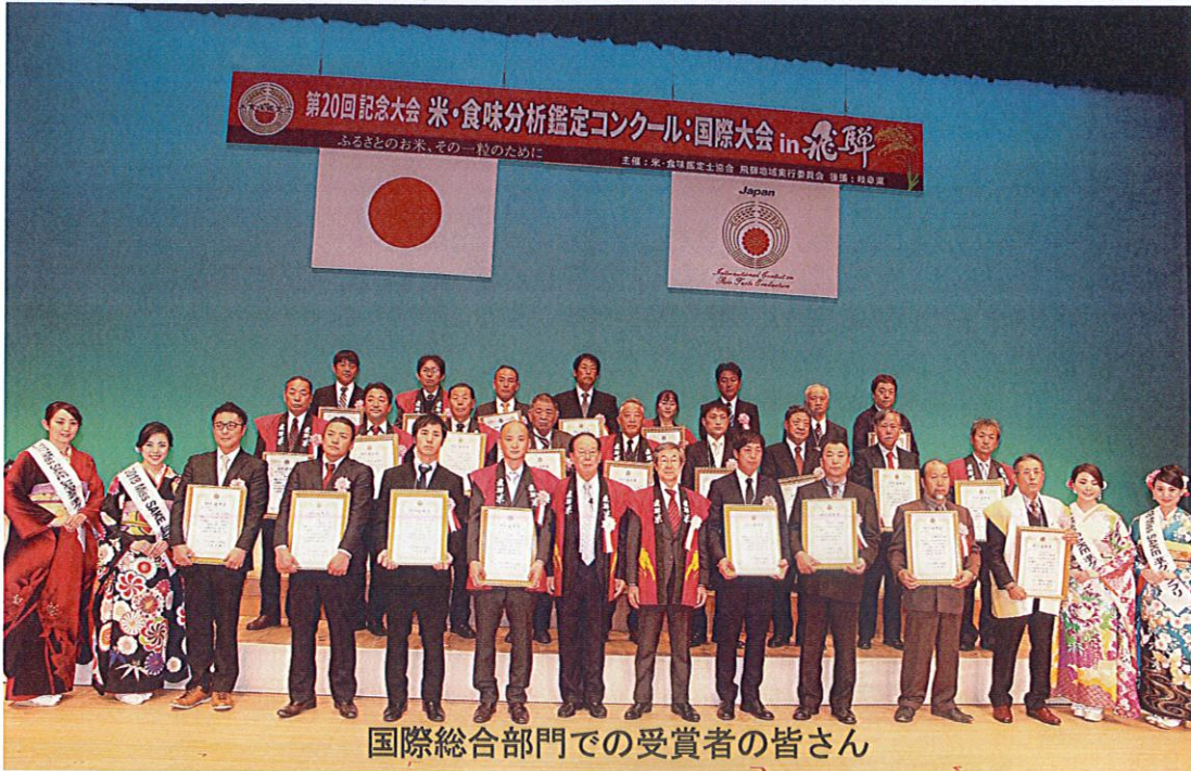
国際総合部門での受賞者の皆さん