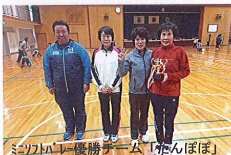
ミニソフトバレー優勝チーム「たんぼぼ」

一之宮商工会青年部主催の第9回「一之宮商工会杯ソフト(ミニ)バレー大会」が12月16日、宮小学校体育館にて開催され約78人が参加し、汗を流しました。ミニソフトバレーに5チーム、ソフトバレーに11チームが参加し、熱戦の中、見事優勝したチームは、ミニソフトバレーの部「たんぼぼ」、ソフトバレーの部「アレスタ」でした。