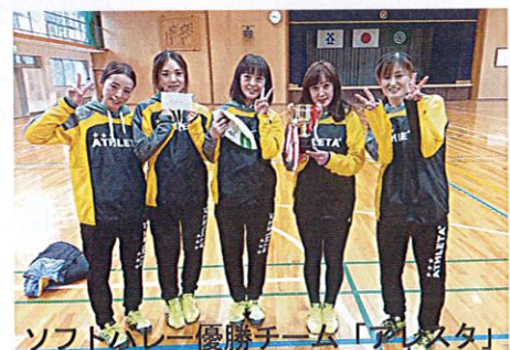
ソフトバレー優勝チーム「アレスタ」