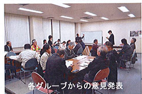
各グループからの意見発表

初めに市側から将来推計を含めた一之宮町の状況の説明があった後、ワークショップ形式で参加した住民約20名が、地域の特徴・地域活動の成果・地域の将来像及び将来の取り組みについて熱心に意見を出し合いました。これらの意見が総合計画の見直しに反映されることを期待します。