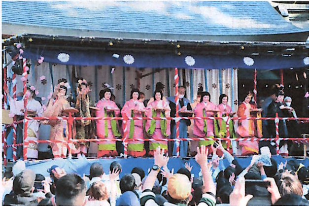
餅まきも4年ぶりに開催

農業の繁栄と女性の健康、幸福を祈る生きびな祭りが4月3日、水無神社で行われました。飛騨地域から公募で選ばれた9人の女性が、内裏や后、官女にふんし、神職らとともに神社から飛騨一ノ宮駅までの道のりを満開の桜のもと、1時間ほど練り歩きました。