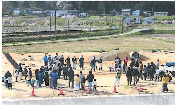
集まったボランティアは70人以上

当日は朝から好天の中、小中学生の他親子連れや実行委員など総勢70人を越えるボランティアが参加しました。