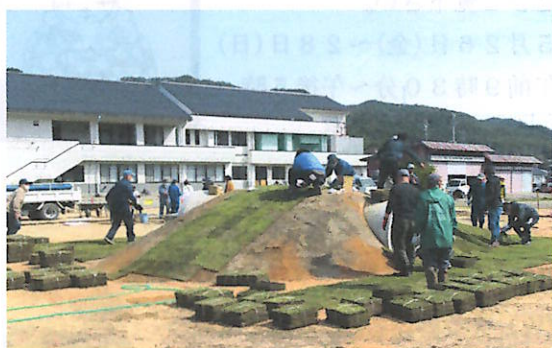
築山の芝張りの様子