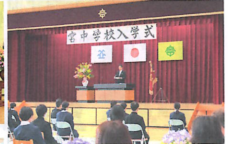
【中学校】入学式の様子