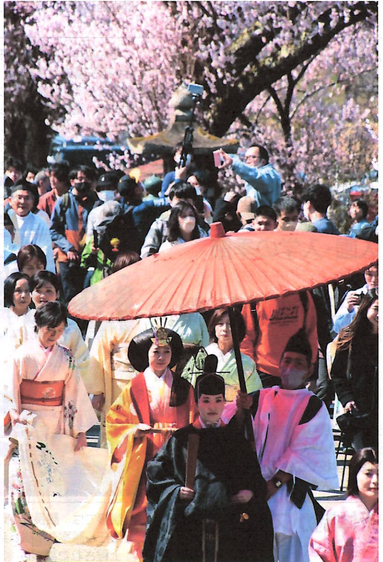
桜の咲く中での生きびな行列

農業の繁栄と女性の健康、幸福を祈る生きびな祭りが4月3日、水無神社で行われました。飛騨地域から公募で選ばれた9人の女性が、内裏や后、官女にふんし、神職らとともに神社から飛騨一ノ宮駅までの道のりを満開の桜のもと、1時間ほど練り歩きました。