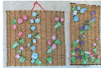
カロリア利用者さんの作品「朝顔」 障子紙に絵の具を染み込ませ、朝顔の色をつけました。(交流館)