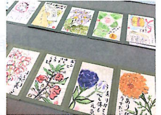
絵手紙クラブ作品 (公民館 8月末までの予定)