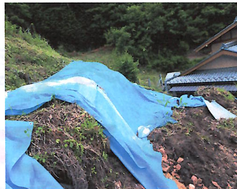
土砂が家屋に流入(段地区)

7日避難指示を受けて、一之宮公民館へは53名が避難されました。また、消防団も召集がかけられ対応されました。そして、二二会のメンバーがボランティアでおにぎりの炊き出しをされました。自分のことで精一杯のところ、他人のことを考えて活動され、本当に頭が下がります。