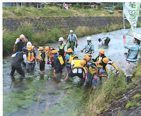
引っ越し作戦実行中!

水との闘いは続くと思いますが、児童たちの思いをつなぐため「梅花藻を守る会」を中心に地域全体で梅花藻を守って行く必要があると強く感じました。