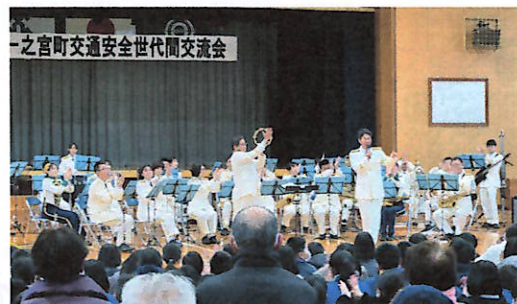
素晴らしい演奏を披露した県警音楽隊