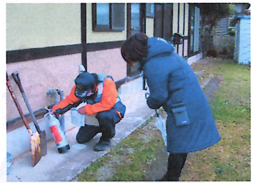
消火器点検の様子

これから寒さが厳しくなり、火気(ストーブなどの暖房器具)の取り扱いが多くなる時期となりますので、各家庭で『我が家の火災予防 火の元点検チェック表』などを参考にして、自分の財産を守るために、今一度、火災予防に努めましょう。