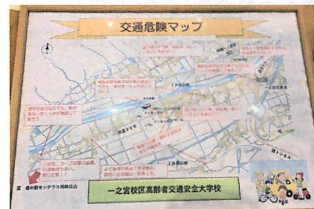
児童生徒に贈られた「交通危険マップ」