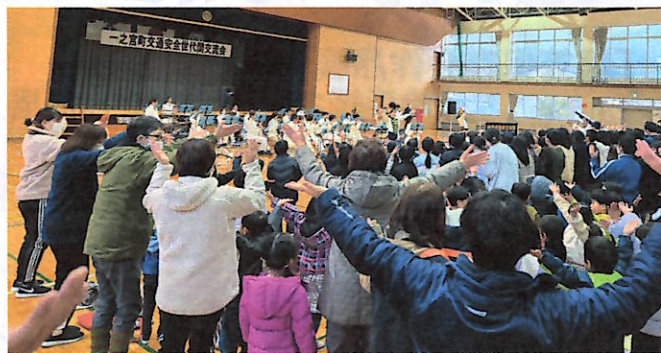
県警音楽隊と一緒に楽しんだ参加者

高齢者交通安全大学校は65歳以上が対象で50名程度が参加、今年度8回開催予定のうち、今回が7回目。交通安全マップには「道が狭いので自転車や歩行者は気をつけよう」「一旦停止注意」など地域ごとに気を付けたい場所、注意事項が書かれていました。交通事故の犠牲者となりがちな子どもたち、高齢者対象に、お互い気を付け合いましょうという良い会でした。