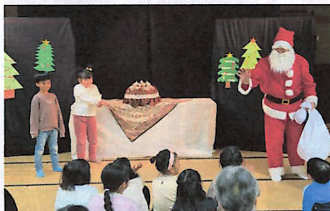
ぐりとぐらを演じた子どもとサンタさん

お話玉手箱さんによる大型絵本『おしから・まんじゅう』『もりのおふる』『まどから★あくりもの』の読み聞かせのあと『ぐりとぐらのおきゃくさま』の人形劇を披露。劇のクライマックスでは、