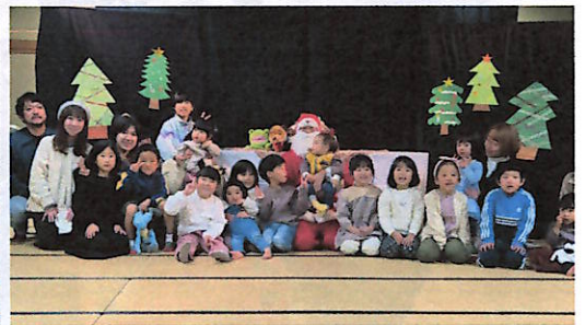
サンタさんと記念撮影

べる工作キットを手渡しされると嬉しそうに受け取っていた子供たち。おはなし会でひと足早いクリスマス気分を満喫しました。