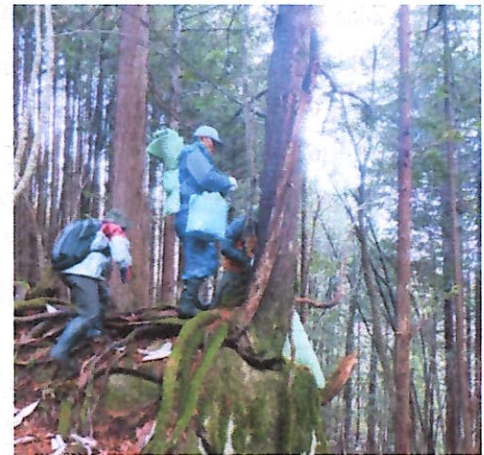
守る会による調査・保護活動

多くのイチイが確認されましたが、その多くは食害を受けており、一本は枯死寸前のももありました。会では今後も継続的に保護活動を行う予定とのこと。皆さんも活動に加わってみませんか。(事務局はモンデウススキー場にあり。興味のある方は☎53-2421まで)