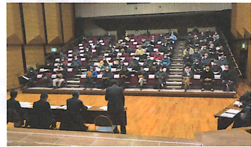
コロナ禍の中多くの参加者が熱心に集う