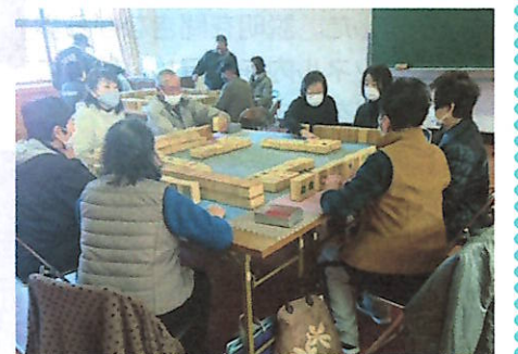
コミュニケーション麻雀を楽しむ参加者

してください。問い合わせは社会福祉協議会一之宮支部(☎53-0294)吉朝さんまで。新しい年明け、今年はコミュニケーション麻雀にチャレンジしてみませんか。