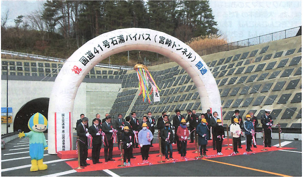
テープカットとくす玉でお祝い

12月12日、国道41号石浦バイパス1工区、4.7kmのうち1,863mの通称宮峠トンネル部分が開通しました。平成28年に起工式を行ってから、5年余りの年月でしたが、冬季の凍結を前に開通された、念願の宮峠トンネルです。これまで標高782mの宮峠は急なカーブが連続し事故の多いところでした。今後は降雪の心配も無く、時間的にも早くなり、気分的に楽に通過できます。また、緊急搬送時間の短縮や観光事業にも寄与します。