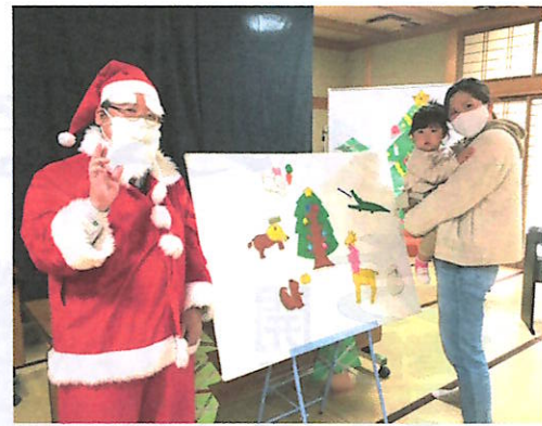
緊張しながらサンタさんと記念撮影

わず立ち上がって絵本に触れようとしたり…。パネルシアター『もりのクリスマス』ではサンタさんが登場！「メリメリ♪クリスマス」のメロディを一緒に口ずさみながら手拍子を打ち、おはなしの世界に浸っていました。家で作る工作キットを受け取ったあと、サンタさんと記念写真を撮り終了。新型コロナウイルス感染予防のため30分間という短い時間でしたが、岐路につく子どもたちは笑顔いっぱいでした。