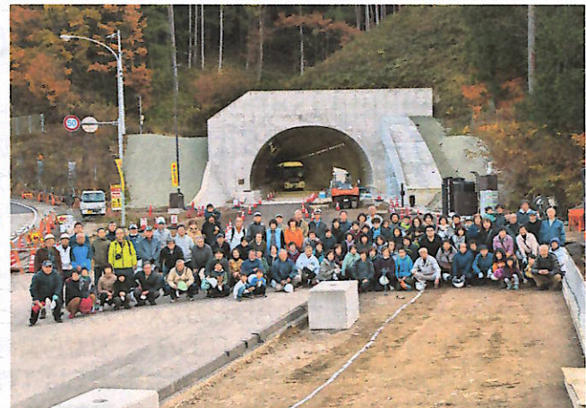
一之宮側抗口で記念撮影