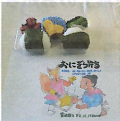
応援おにぎり弁当

10月17日及び11月21日に宮小学校へ、また12月19日の土曜日には宮中学校へ、スタッフが弁当を持参して直接子どもたちに、また同時に教職員の方々にも感謝を込め配りました。