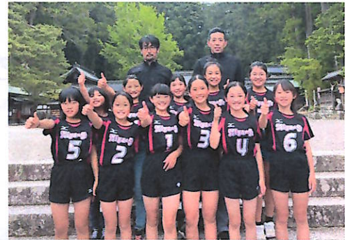
宮ジュニアバレーボールクラブの皆さん

選手たちは、最後まで諦めず本当に良くやってくれました。次の大会に向けて頑張りますので、応援よろしく申し上げます。