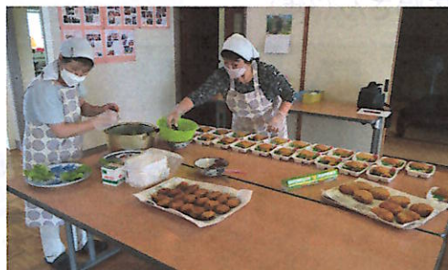
二二会スタッフの弁当準備の様子

「二二会」では、「であい塾」に通う子どもたちや関係者向けに、毎月1回の昼食の提供を長年続けていらっしゃいます。通常ですとであい塾別館で二二会スタッフ6名が、朝9時から食事の仕込みに入り、子どもたち・であい塾関係者とスタッフの皆さんが、昼食を一緒に楽しく食べるとのことです。