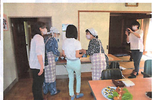
歓談しながら弁当を渡します

スタッフの皆さんと一緒に食べた愛情満載の和牛ミンチ入りコロツケ弁当は、大変美味しかったです。