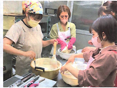
豆腐作りの様子(上)と、七夕飾り(左) 七夕飾りはわいわいルーム(旧Aコープ)に展示してあります