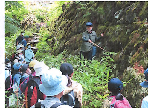
松倉城の石垣の説明の様子

飛騨の里では、一之宮町から移築された「旧中藪家」を訪れ、家屋の成り立ちや当時の暮らしの説明を受けた後、園内で用意された美味しいお弁当をいただきツアーを終了しました。