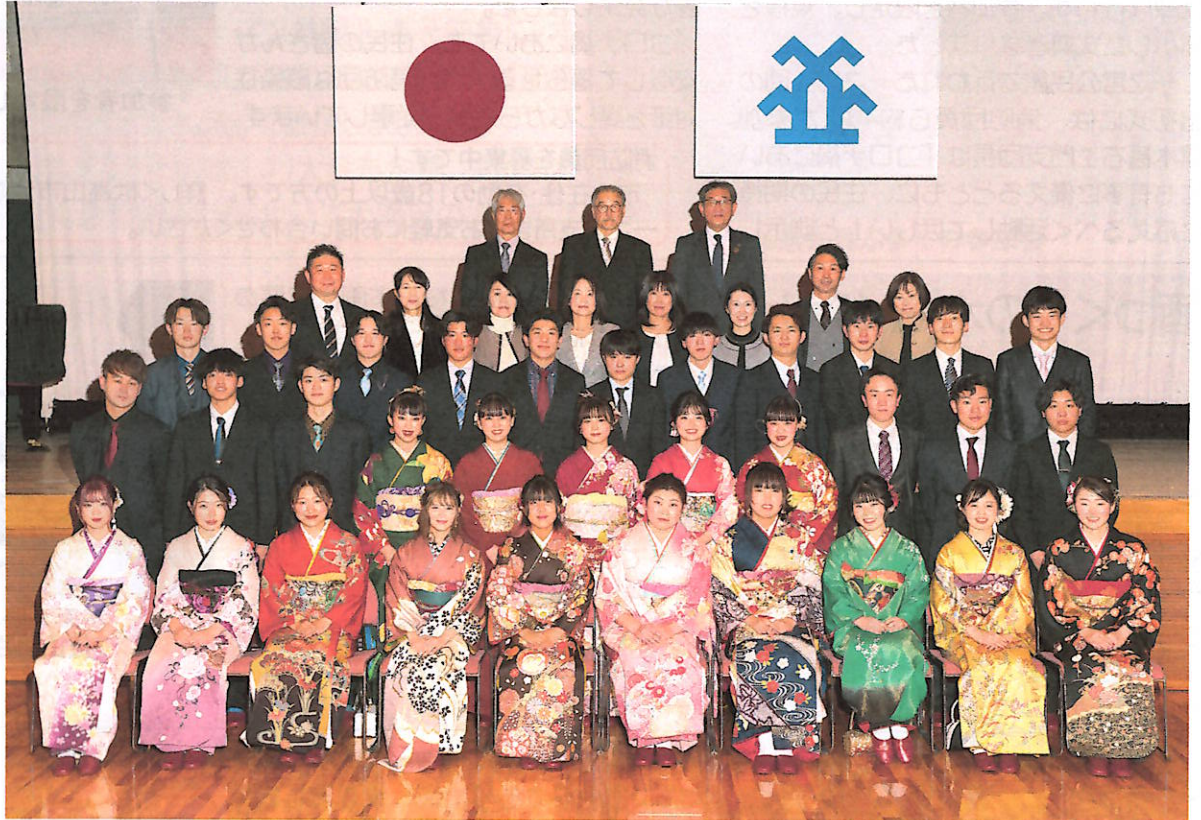
式典に参加した新成人と恩師の先生、主催者の皆さん

新年に入り高山市の「新成人を祝うつどい」が各地域で開催され、一之宮地区では1月2日に一之宮公民館ホールで、感染防止に配慮しながら新成人の門出を祝いました。