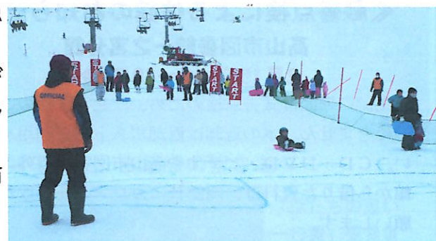
ソリ大会を運営する商工会青年部