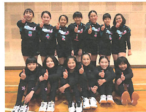
宮ジュニアバレークラブの皆さん