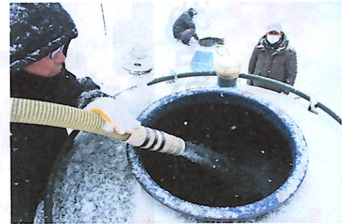
水をくみ上げる関係者(位山の白銀神社付近)

フルーティな香りとやや辛口の淡麗な味わいが特徴。一本2,400円(税込)720mlで、新酒の販売は4月上旬からです。