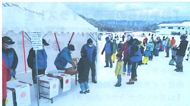
抽選に並ぶ多くの参加者