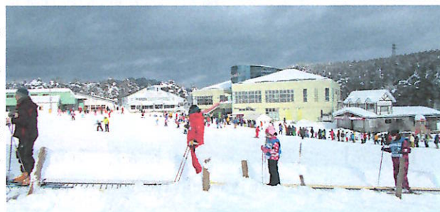
幼児も楽しめるバンビーノ