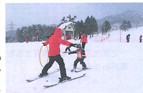
上手に滑れるようになったよ！