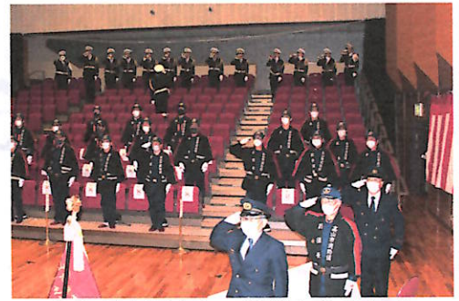
参加者を限定して開催した出初式