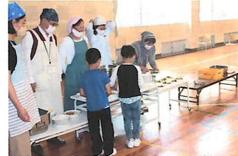
小学1年生の給食配膳の手伝い