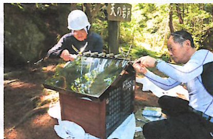
天の岩戸で組み立てました