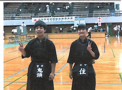
県大会での宮中剣士たち