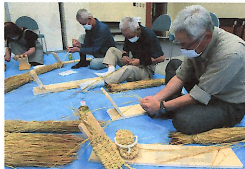
「縄ない」を学ぶ参加者