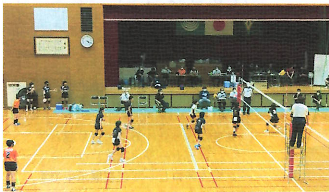
女子バレーボール部 飛騨地区大会の様子

部活動などの練習で汗をかき、技術を磨こうと思っても中々上達できないことに苦しんだことや大会での敗戦に涙したことでしょう。特に3年生は最後の夏です。やり残したことがあるかもしれませんが、それでもこれら全ての体験やドラマが、生徒それぞれの血となり肉になることを信じて、次の目標に向かって走ってほしいと思います。