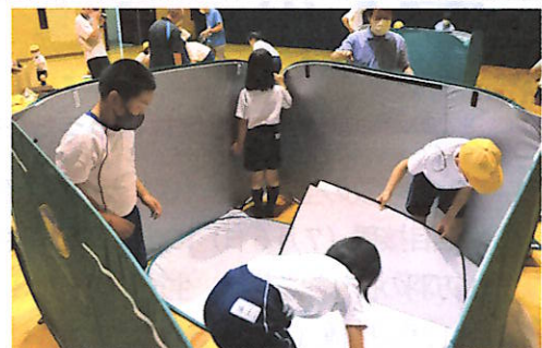
間仕切りを組み立てる児童

その後、非常食などが備蓄されている倉庫を見学し、一之宮公民館では備蓄品のうち、間仕切りや段ボールベッド、簡易トイレの組み立てを体験。児童は「災害時には私たちも組み立てることができる」と、自信につながっていました。