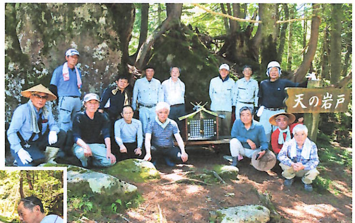
設置に携わった皆さん