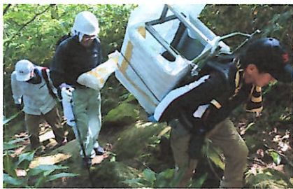
分解した祠を背負い運びました