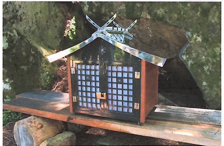
天の岩戸に設置された新しい祠