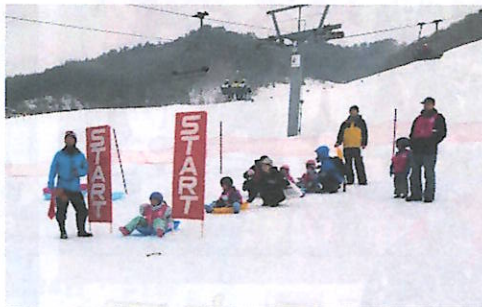
スタートを待つ参加者