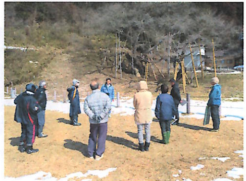
保全説明会の様子

春にきれいな花を咲かせる町のシンボル「臥龍桜」を、これからも地域住民で守っていききたいと思います。