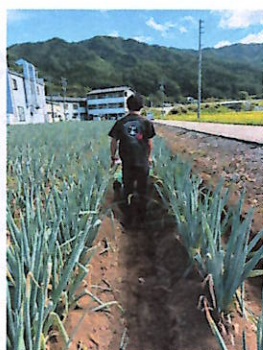
トマトに加え、飛騨ねぎも栽培

大切にしていることは、作物一本一本に手をかけ管理すること、働く人にとっても働きやすい環境にすること、環境に配慮し収穫後の作物を再利用し有機肥料の活用するなど、美味しいトマトやネギづくりをめざすことです。まだまだ耕作地を増やしたり、空き家を使った体験型の民泊を構想するなど「地域に足を運んでくれる人を増やし、地域に貢献したい」と張り切ってみえます。