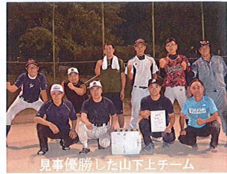
見事優勝した山下上チーム