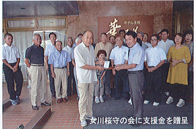
女川桜守の会に支援金を贈呈

一之宮町まち協では、まち協設立5周年記念事業として2泊3日の日程で『東北被災地復興応援ツアー』を実施し、29人が女川町と南相馬市を訪問しました。8月22日の朝、交流を続けている『女川桜守の会』に支援金15万円を贈呈し、更に絆を深めるとともに、