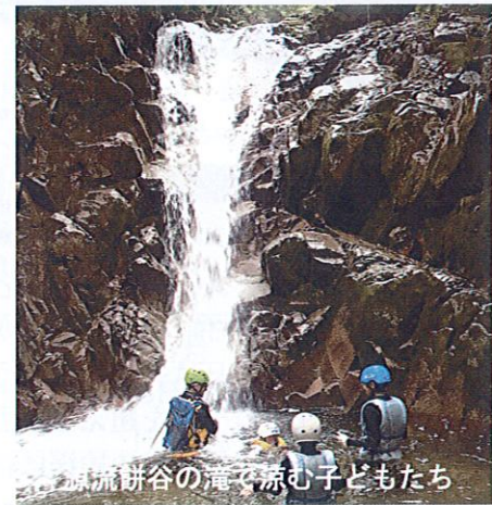
源流餅谷の滝を涼む子どもたち

モンデウスでは、秋の位山で登山やきのご狩りを計画中とのことですので、近いうちにご案内できると思います。乞うご期待！