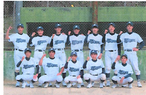
優勝した宮中学校野球部の皆さん