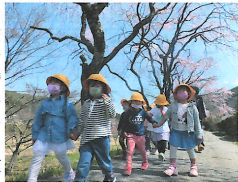
♪歩こう♪楽しいお散歩する宮保育園児

一之宮町での行事も、コロナ禍により飛騨一宮水無神社の生きびな祭の延期や例祭の縮小、臥龍公園での桜まつりの中止など去年に引き続き影響が出ています。高山市でもまもなく高齢者の方々から順次ワクチン接種が開始されると思いますが、まだまだ油断はできません。町民一人一人が新型コロナウイルス感染防止対策を徹底してコロナ禍を乗り切り、皆さんと一緒に思いやりのある明るい生活を送りたいものです。皆さん頑張らしましょう！