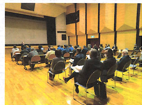
熱心に協議する代議員の皆さん

なお、令和3年度役員、各専門部の主な計画等については来月のまち協だよりで紹介いたします。