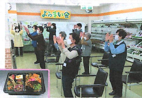
体操を楽しむ参加者

おおむね75歳位から、一週間前までに申し込んで参加できます。見学も自由に。毎月第2水曜日によらまいかい！