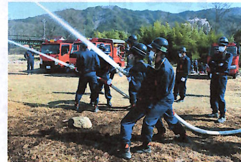
放水訓練をする消防団員