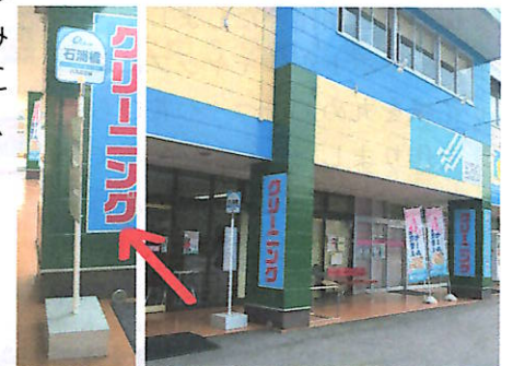
スーパーさとう敷地内のバス停