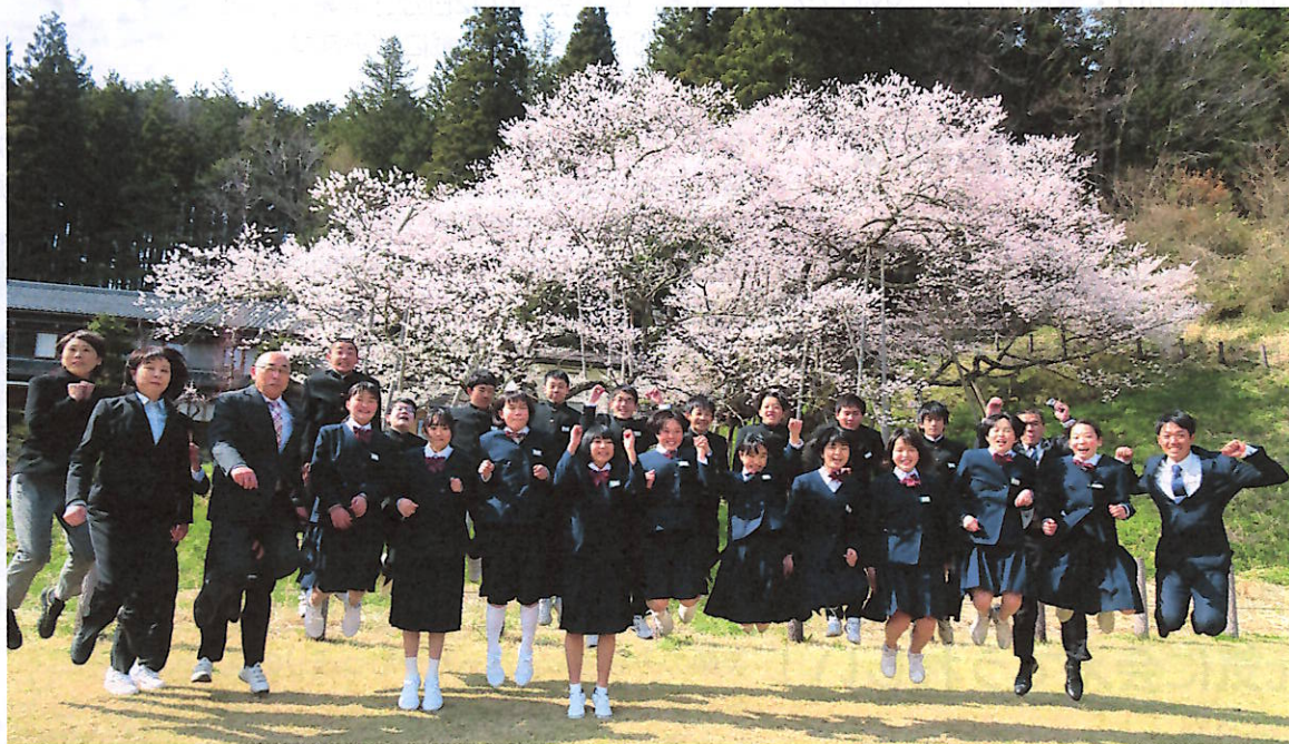
臥龍桜のパワーをもらって来春に向かってジャンプ！ 宮中3年生と先生方

一之宮の里は四季折々色々な表情を見せてくれますが、その中でも厳しい冬を乗り越えた後の春は、樹々は芽を吹き緑も増して生命の躍動を感じさせ、また花々が庭先や河川敷などに咲き乱れ華やかだ景色を醸し出し、心も浮き浮きになる季節です。