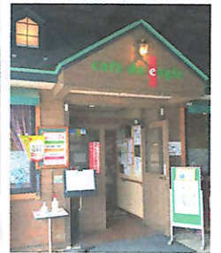
イーグルコーヒー