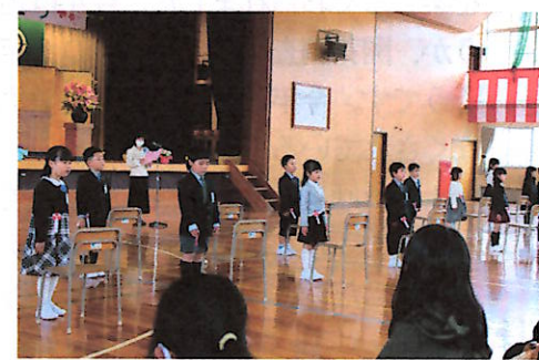
元気にあいさつする宮小一年生