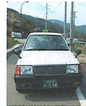
デマンドタクシーの車輛