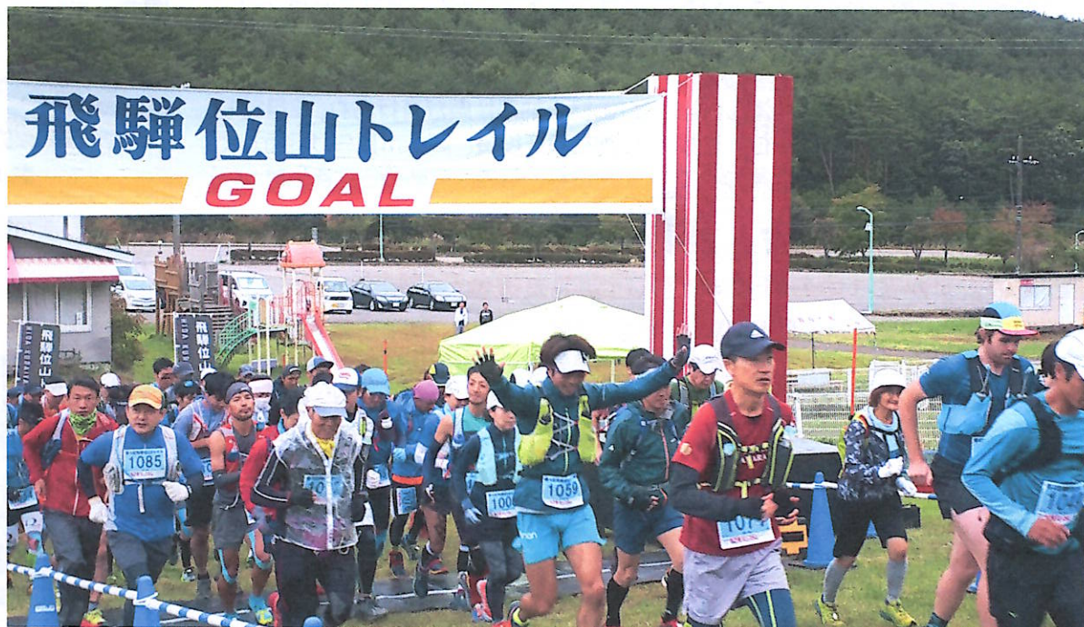
モンデウススキー場を駆け上がる選手たち