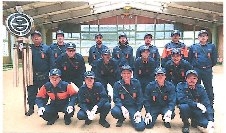
第1分団の精鋭団員の皆様