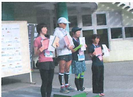
手作りのメダルで応援

10月5日・6日、西は兵庫県東は栃木県と18県より300名を超える選手を集め、第4回飛驒位山トレイルランが開催されました。今年は5日に位山ダウンヒルコースが設けられ、ダナ林道から天の岩戸、スキー場6Kmを30分余りで駆け抜けました。6日は40Kmのロングコース、12kmのショートコースが行われました。前夜祭も行われ、選手を歓迎しました。当日は、宮中生徒が開会式でのブラスバンドで会を盛り上げたり、会場員、エイドや関門員として選手を応援したり、大会の運営を補助してくれました。また、保育園児や小学生もメダ