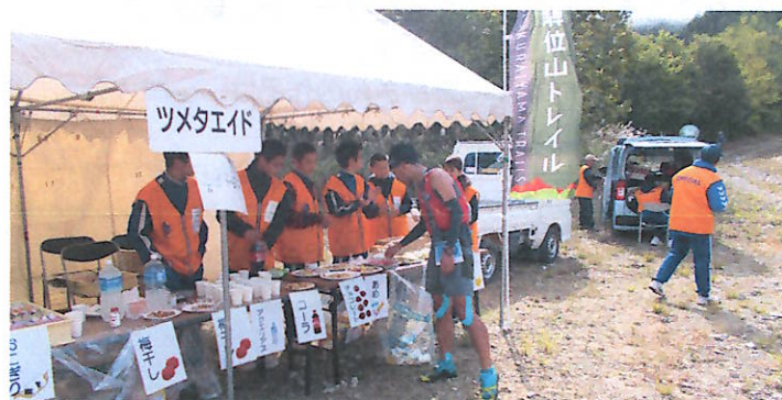
おもてなしをするエイドの中学生

10月5日・6日、西は兵庫県東は栃木県と18県より300名を超える選手を集め、第4回飛驒位山トレイルランが開催されました。今年は5日に位山ダウンヒルコースが設けられ、ダナ林道から天の岩戸、スキー場6Kmを30分余りで駆け抜けました。6日は40Kmのロングコース、12kmのショートコースが行われました。前夜祭も行われ、選手を歓迎しました。当日は、宮中生徒が開会式でのブラスバンドで会を盛り上げたり、会場員、エイドや関門員として選手を応援したり、大会の運営を補助してくれました。また、保育園児や小学生もメダ