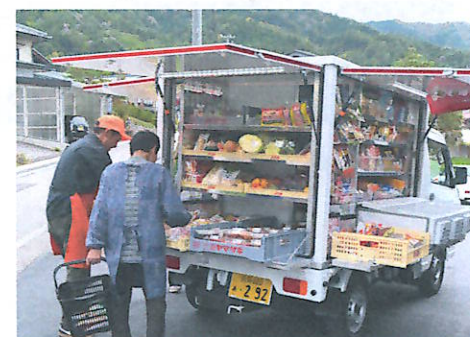
とくし丸で買い物する利用客

野菜やパン、魚などの可愛らしいイラストが描かれた軽トラが目印。陽気な音楽が聴こえたら『とくし丸』が到着した合図です。