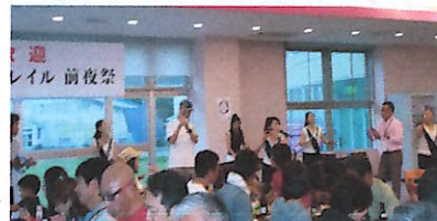
前夜祭も盛り上がりました

ルを作ってくれたり、メッセージを送ってくれたり町ぐるみで、選手を迎えることができました。