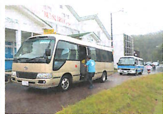
ダウンヒルの選手を輸送