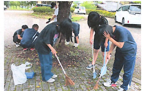
日頃の感謝を込めて

昨年の清掃活動は、コロナ感染を考慮して役員のみでの活動でしたが、今年は高校生も参加して総勢47名で行われました。飛騨一ノ宮駅ではJRのスタッフに安全確保をしていただきながら、構内の草刈りや駅舎の窓拭きなどの清掃活動に汗を流しました。