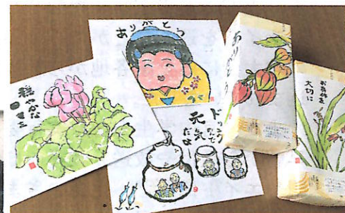
心のこもった表書き(上)