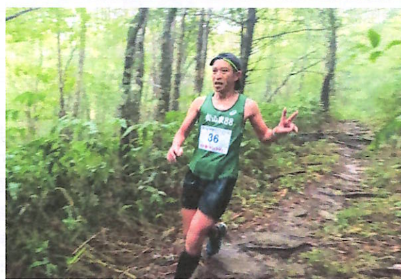
雨の中、位山を駆ける選手（9月23日）

位山（1529m）などを駆ける「飛驒位山トレイル」が9月23日・24日、モンデウスを発着点に開催される予定でした。雨の中23日のダウンヒル種目は実施できましたが、同日午後5時過ぎに発表された大雨警報を受け、24日の本大会は残念ながら中止となりました。