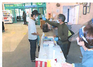
コロナ対策をして受付