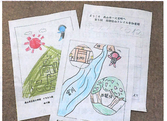
心がこもったメダルとカード

が、50人以上が大会のスタッフとして従事。開会式や表彰式の演奏をはじめ、関門やエイドなど、幅広く運営に活躍する予定でしたが、あいにく大雨警報が発令され中止となりました。