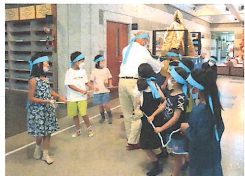
大きな声でわっしょい！わっしょい！