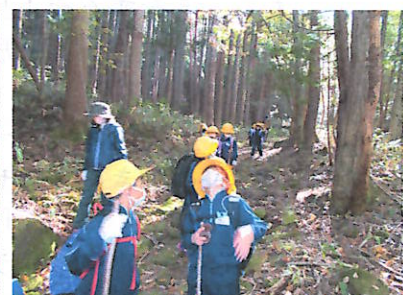
古道歩こう！歩こう！