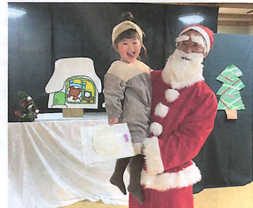
二代目サンタと記念写真

劇に登場したサンタさんが、白い大きな袋の中から、家で作って遊べる「工作キット」を子どもたち一人一人に手渡しすると、恥ずかしそうに「ありがとう」と受け取っていました。みんなのところに、きっとサンタさん来てくれるから、いい子にして待っててね！