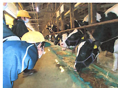
牛さんの大きさにビックリ