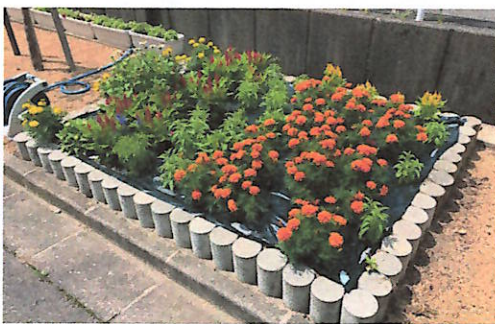
銅賞を受賞した宮中学校の花壇