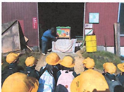
紙芝居に見入る児童たち

県道を少し下り、いにしえより造られた「位山古道」に分け入りしました。江戸時代に敷き詰められた石の上を自分の足で歩き、むかし段地区の子どもたちは冬でも家から学校まで徒歩で通学していたことも聞き、移動の大変さを感じたようでした。