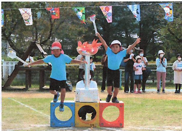
年長 オープニング「聖火リレー」