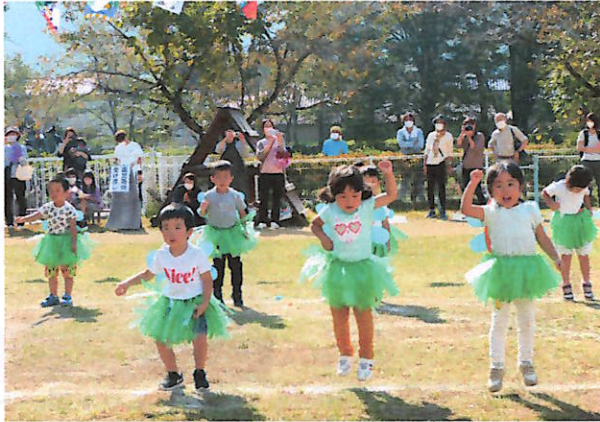
年少 遊戯「ムシキングサンバ」