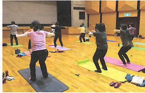
ヨガを楽しむ参加者

評でした。「また機会を作ってほしい。次は5回くらい体験したい」と次回開催を望む声も聞かれました。