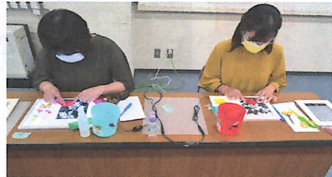
シルエットアート講座の様子