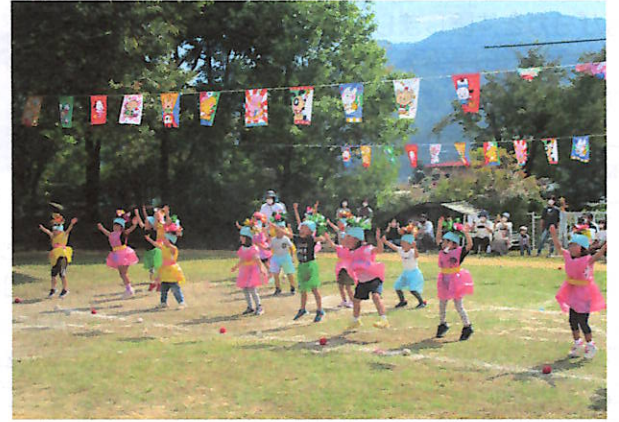
年中 遊戯「パラリルラ」