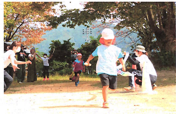
年長 「ぜんりょく☆リレー」

待ちに待った運動会。10月9日(土)秋晴れの空の下、運動会ができることの喜びが朝の園庭に広がっていました。