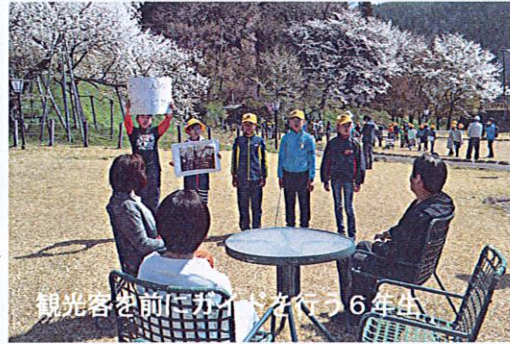
観光客の前にガイドを行う6年生

この日は5年生が写生にも来ており、臥龍桜を通した郷土を大切に学習が行われていると嬉しく感じました。