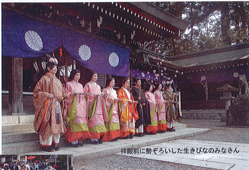
拝殿前に勢ぞろいした生きびなのみなさん