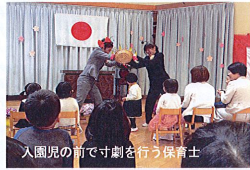
入園児の前で寸劇を行う保育士

一之宮の子ども達は12年間ほぼ一緒ですが、入学園を節目としてたくましく成長してほしいものです。