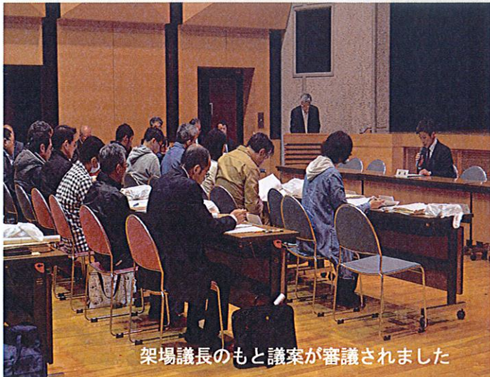
架場議長のもと議案が審議されました

今回の「まち協だより」では、総会特集として、平成30年度の部門別事業計画の主要なものについて、右表の通りお知らせします。