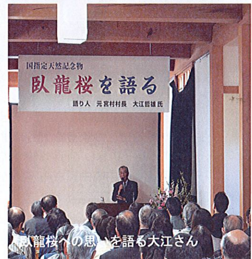
臥龍桜への思いを語る大江さん