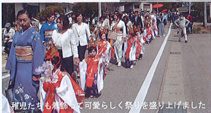
稚児たちも着飾って可愛らしく祭りを盛り上げました

飛騨路に春を呼ぶといわれる恒例の「生きびな祭り」が4月3日に、今年は天候にも恵まれて、主催者発表5,000人を超える参観者を集め盛大に行われました。