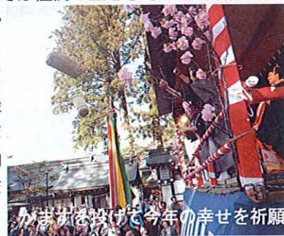
かますを投げて今年の幸せを祈願

その後、特設の舞台では恒例の生きびなによる餅まきがありました。ひし餅や繭の形の団子が投げられ、観客は、われ先にと拾っていました。最後には「かます」をまき、今年の豊作と家内安全、健康を祈願しました。