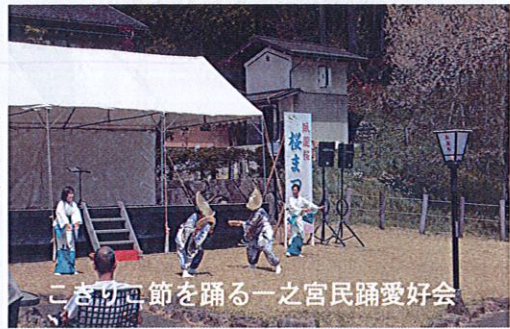
こぎりに節を踊る一之宮民謡愛好会