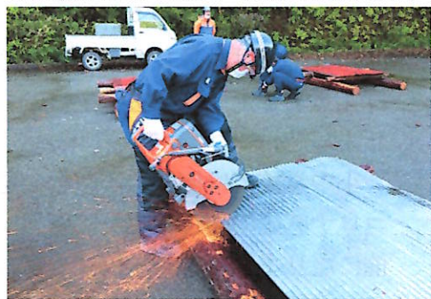
本番を想定した訓練

【救助資器材の配備について】今年2月に下記機材一式(チェーンソー、エンジンカッター、防護資器材、バール)が高山消防署より各分団へ配備されました。