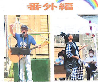
校長先生、職員によるパフォーマンス (中学校)