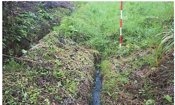
管理が行き届いた排水路(手前側)と不十分な排水路(奥側)。このように草に覆われ根が入りこむと、詰まりの原因となり排水機能が低下します。そうした水路は、大雨の際に氾濫し下流域の宅地が浸水したり、稲刈り時に排水が出来なくなり、作業を著しく困難にします。