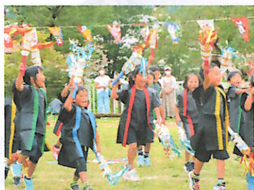
かわいいお遊戯 (保育園)

子どもたちは、今年コロナ禍のため、学校や地域などの行事が中止や延期を余儀なくされ、発表や活躍の場の多くを失くしてしまいました。それでも子どもたちは、今回の運動会や体育祭でコロナ禍に立ち向かう「たくましい姿」を見せてくれました。