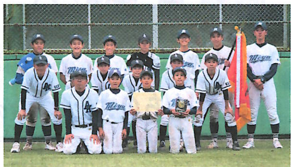
優勝した 宮・朝日・久々野中学校合同チーム

な力を引き出しています。そんなチームが、県内の強豪相手にどんな野球をするのか楽しみです。