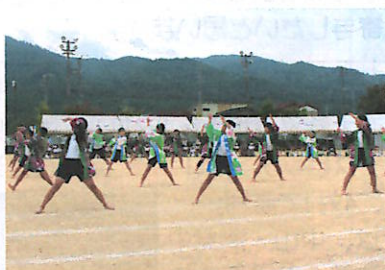
庄巻のソーラン節 (小学5・6年)