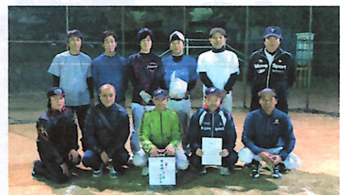
準優勝チーム 問坂上・一之宮上班

まち協体育部では、ソフトボール大会に続いて、野球大会を開催し、6チームが参加しています。