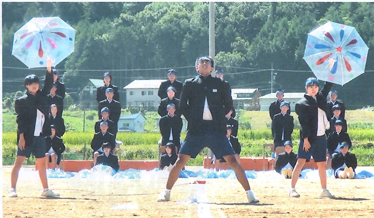
中学校応援合戦「勝利を我らの手に！」

今年はコロナ禍により、保育園や学校での運動会開催が危ぶまれましたが、秋の気まぐれな天気をかいくぐり、宮保育園・宮小中学校では消毒の徹底や観客人数の制限など感染防止対策を万全に行うと共に内容を大きく縮小して、すべて開催することができました。