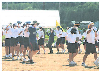
手袋着用でフォークダンス (中学校)