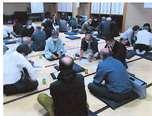
班長を中心に話し合い

「命のバトン」制度は急病時に必要な情報を一刻も早く救急隊員に知らせるためのものです。避難行動要支援者名簿の作成は、自主防災組織、消防団と共に災害時避難支援を行うものです。どちらの制度も自主申告や家族の同意が必要ですので、詳細については町内の班長や見守り推進委員、民生委員、社会福祉協議会、支所等へご相談下さい。町内会未加入者も申し込みができます。コロナ禍で地域の集まりも少なくなりがちで、近所の情報も入りにくい最近ですが、地域を守る情報の交流は大切と改めて感じました。