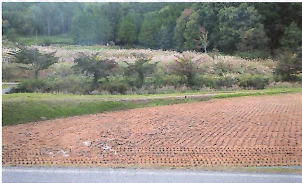
集落(手前側)に迫りくる耕作放棄地(奥側)。耕作放棄地は、集落の景観を損ねるだけでなく、病害虫や野生鳥獣のすみかとなり、農産物や生活環境に悪影響を及ぼします。(高山市某所)

水田、畑、宅地、そしてそれらを取りまく森林が一体となって、美しい田園風景を形成している一之宮町。宮トンネルを抜けると目の前に広がるその風景は、人々の心をなごませ、ほっと一息つかせてくれる「心のふるさと」と呼べる貴重な財産です。