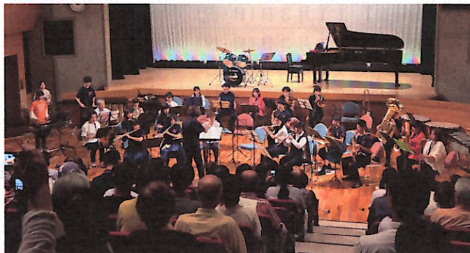
宮中吹奏楽部OB・OGも加わっての演奏

しかし、生徒数の減少などにより朝日中との合同バンドを終了することになりました。そこで、今年の「ありがとうコンサート」では、両校の卒業生との合同演奏や、来年度合同を組む予定の久々野中学校の皆さんとの演奏を行いました。