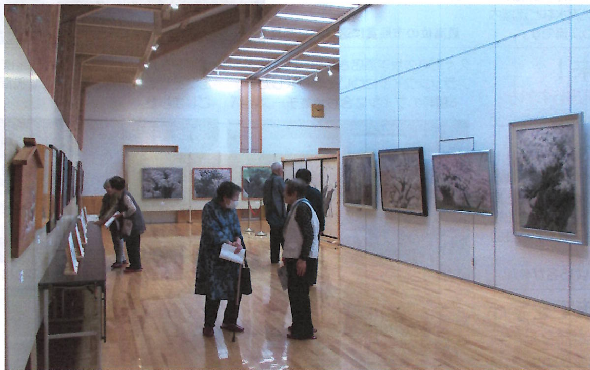
所狭しと並ぶ山腰さんの作品①