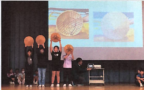
グループ発表の様子

夏の交流でお互いに顔を覚えた子もいて、笑顔で話す姿も見られました。岩瀬浜を見学した時には雨も上がり、楽しいひと時を過ごしました。伝統ある交流会