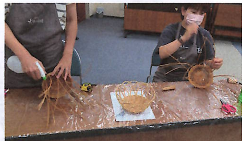
ワイン講座④とカゴ編み講座⑤の様子