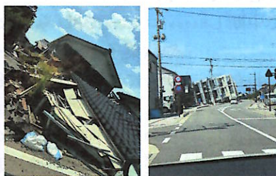
今年7月の輪島市の様子