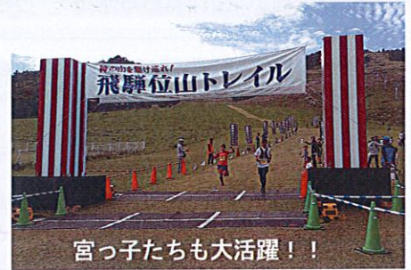
宮っ子たちも大活躍！！