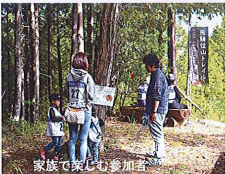
家族で楽しむ参加者

9月23日秋晴れの中、「第3回飛騨位山トレイル」が行われました。第2回から行われている「位山遊びの散歩道」のファミリーコースには106名の参加がありました。ゴールまでに10問の難問クイズが用意しており、いくつかのアスレチックがあったり、山頂の東屋には、お菓子のつかみ取りがあったりと小さい子供から楽しめるコースになっていて家族みんなが十分に楽しむことができました。