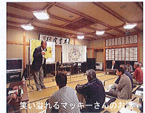
笑い溢れるマッキーさんのお話