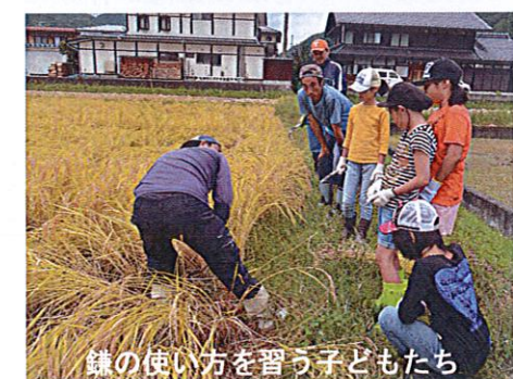
鎌の使い方を習う子どもたち