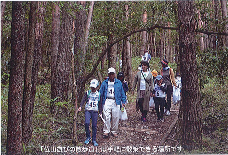
「位山遊びの散歩道」は手軽に散歩できる場所です