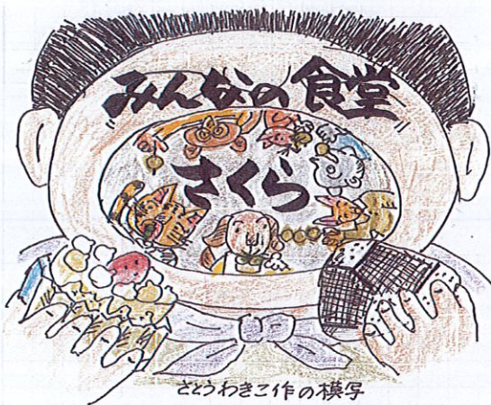
どうわき作の模写