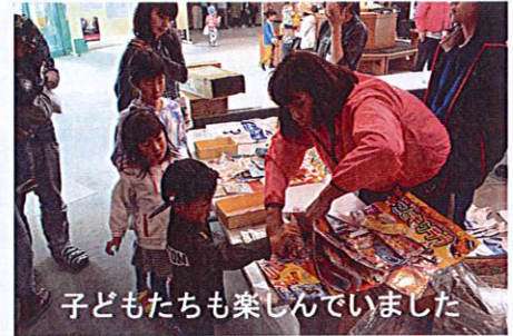
子どもたちも楽しんでいました