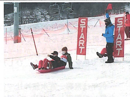
ペア部門 親子でスタート！

また、この日でモンデウススノーパークは営業を終え、今季の感謝を込めて、一日券の購入者を対象に抽選会が行われました。特賞には来年度のリフトシーズン券が当たりました。今シーズンの来場者は、昨年より多く3万人近くに上りました。今年はグレンデにまだまだ滑走できる雪が残っていて、まだ滑れそうで、例年になくもったいない状況でした。スキー場関係者も来季に取っておきたい位だと言ってみえました。