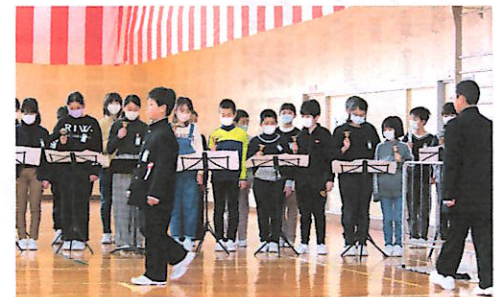
ハンドベル演奏の中を進む宮小卒業生