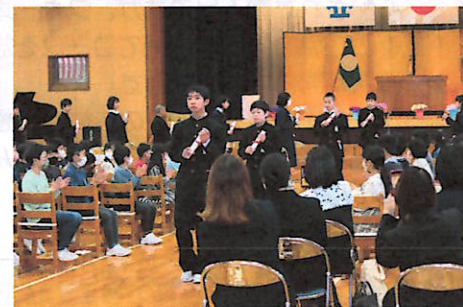
宮小をあとに羽ばたけ！