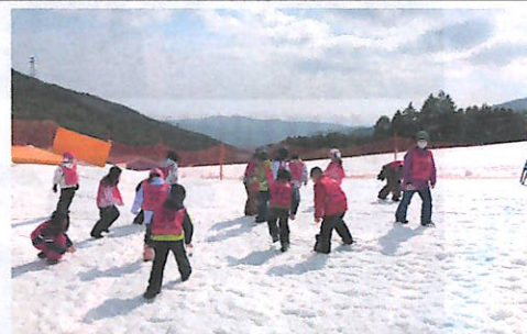
お楽しみ♪宝さがしの様子

タイムを競うそり大会の後には、恒例の宝さがしもあり、参加者は家族みんなで楽しんでいました。