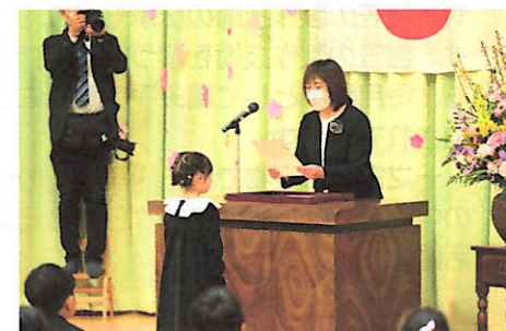
卒園証書を受け取る園児