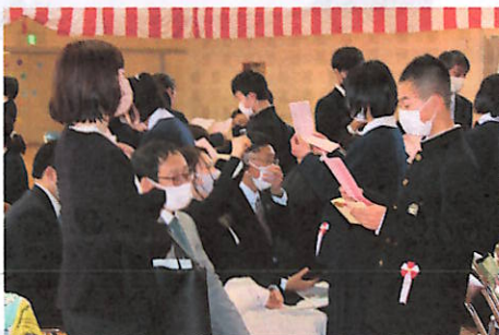
【小学校】 家族へ感謝の言葉