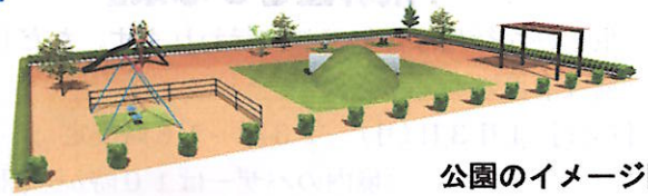
公園のイメージ図

4月23日(日)にはボランティアによる記念植樹祭を実施し、苗木の植樹や芝張り作業が行われます。