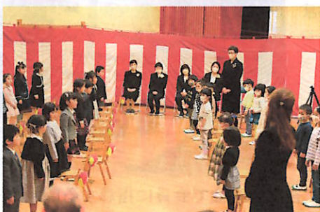
【保育園】 あいさつする卒園児たち