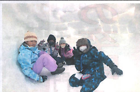
かまくらも初体験!

間の冬山の色々な体験活動や町内の民宿での泊まりを通して、子どもたちはそれぞれの楽しみ方で良い思い出づくりができたようです。