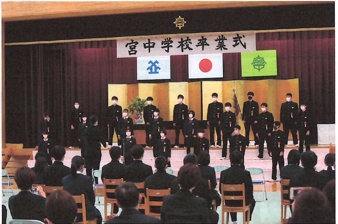
心をひとつにして最後の合唱(中学校)